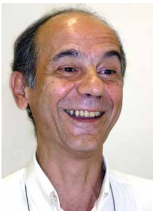
KRAYCHETE: Potencializando a ação das organizações econômicas populares

Coordenado por professor da Católica, extensão tem demanda cada vez maior