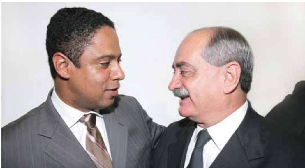
ORLANDO SILVA: recebe os cumprimentos do Reitor José Carlos Almeida na cerimônia de posse

Segundo o novo ministro, a parceria esporte-educação é fundamental para melhorar a qualidade de vida dos jovens e valorizá-los perante a sociedade. “Eu me comprometo em desenvolver todos os nossos projetos e a dar continuidade à luta desenvolvida no Ministério do Esporte”, afirmou, na posse. O ministro destacou também sua expectativa em relação aos benefícios que