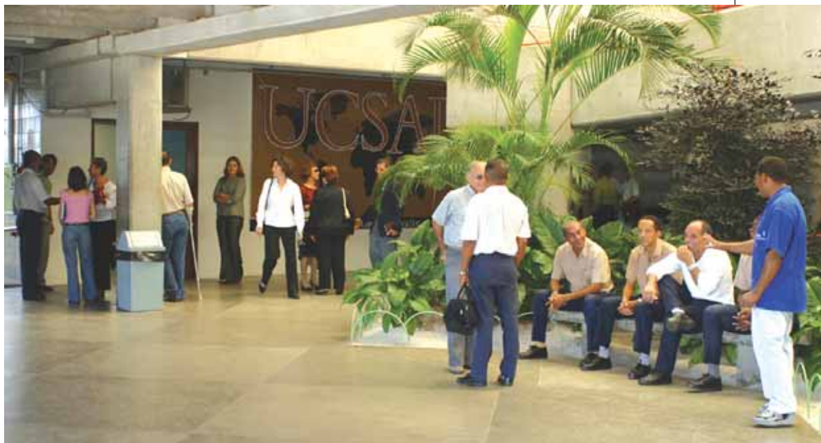
PREAM: Limpeza e relações humanas ajudam ambiente no campus de Pituauçu

Na primeira etapa do programa, foram realizadas campanhas para evitar o desperdício de água, papel toalha, enve-