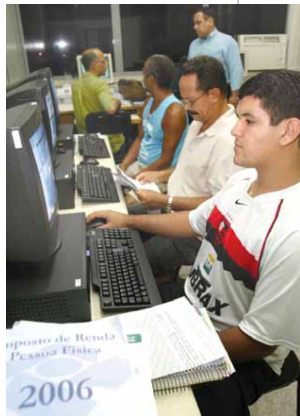
► MÃO: Alunos ajudam a preencher I.R.

Estudantes da Faculdade de Ciências Contábeis da Universidade Católica do Salvador, sob orientação de professores, realizaram consultoria e o preenchimento da Declaração do Imposto de Renda Pessoa Física (IRPF) 2006 gratuitamente para os interessados. Com o objetivo de promover uma prestação de serviço para a comunidade e capacitar os futuros profissionais, o atendimento ocorreu no campus de Pituaçu e ajudou centenas de contribuintes.