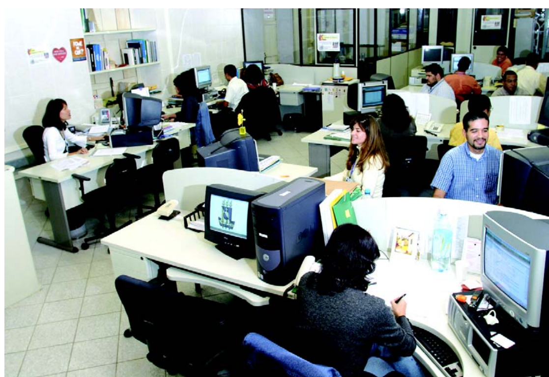
TECNOLOGIA O novo sistema foi desenvolvido no Centro de Processamento de Dados da UCSAL